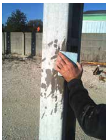
Foto 4 - Afagamento