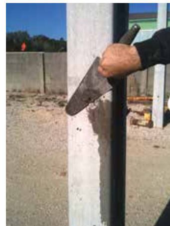
Foto 3 - Aplicação de massa fina