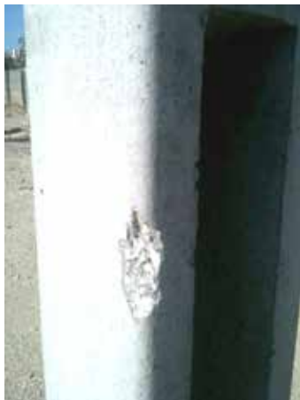
Foto 1 - Identificação da zona danificada do Poste