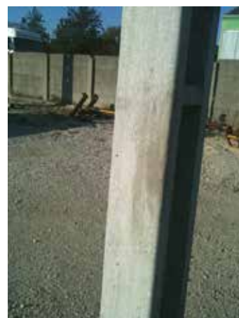
Foto 6 - Poste após intervenção

No local em que o poste estiver lascado / danificado, retira-se o betão que estiver solto e salpica-se com água.