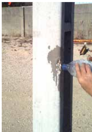
Foto 2 - Salpicar com água o local de reparação