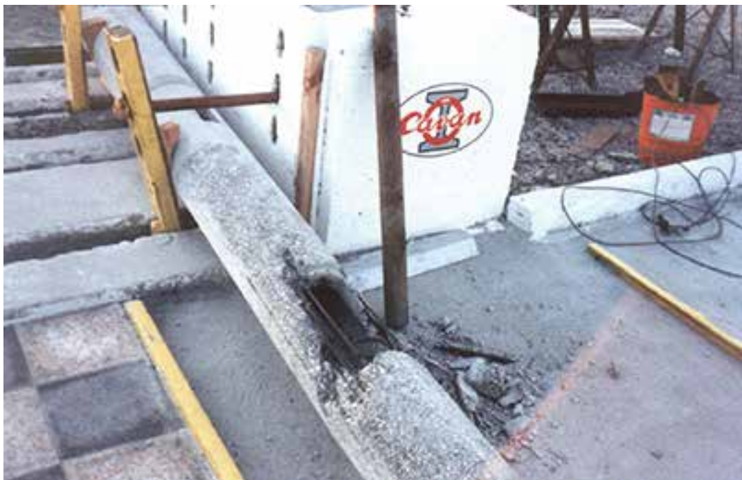
Após ter sido sujeito à carga de rotura