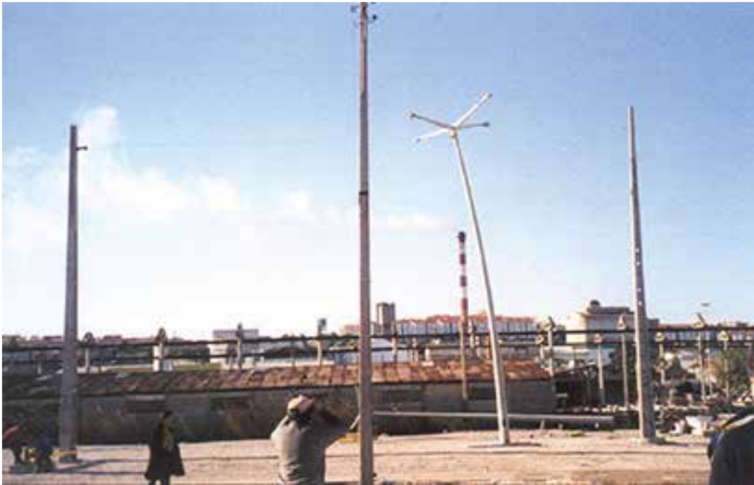
Ensaio à flexão com a coluna colocada na vertical