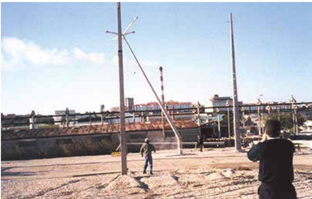
No momento da rotura