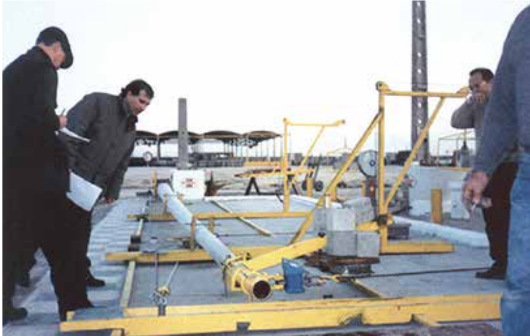
Ensaio à flexão com registo de Flechas e registo de Fendas